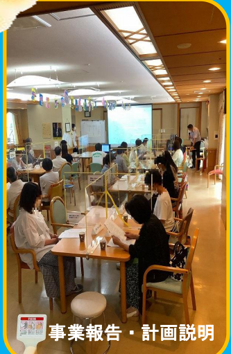
事業報告・計画説明

特養での利用者様の生活のワンシーンを切り抜きました。どのようなことをされているのでしょうか？