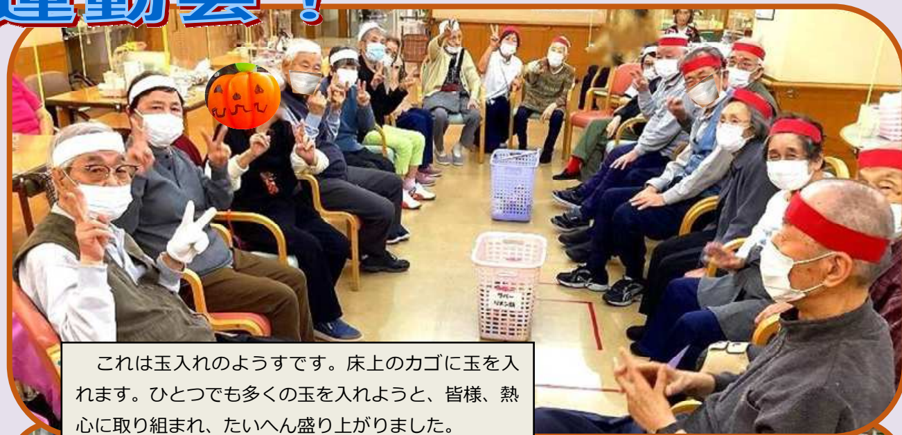
これは玉入れのようすです。床上のカゴに玉を入れます。ひとつでも多くの玉を入れようと、皆様、熱心に取り組み、たいへん盛り上がりました。