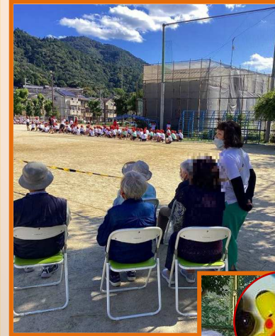
デイサービスの希望者の皆様で小学校の運動会の応援に行ってきました♪