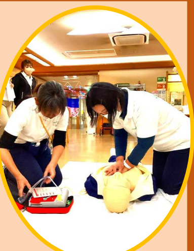
AEDは1階事務室に常備しています。

緊急時の対応について学習し、AEDを用いた救急救命訓練を行いました。 AED(自動体外式除細動器)とは、心停止状態の傷病者に電気ショックを与え、蘇生させる医療機器です。機器が自動的に心電図解析を行い、電気ショックの要否を判断しますので、一般市民でも救急救命時に使用できるものです。 この実践訓練により、職員ひとり一人の救命スキルの維持、緊急の対応時に自信となり、落ち着いて、的確に対処できる救命体制の維持向上に繋がりました。